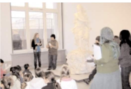
Diana als Jägerin