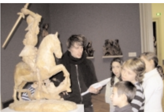
Der Heilige Georg